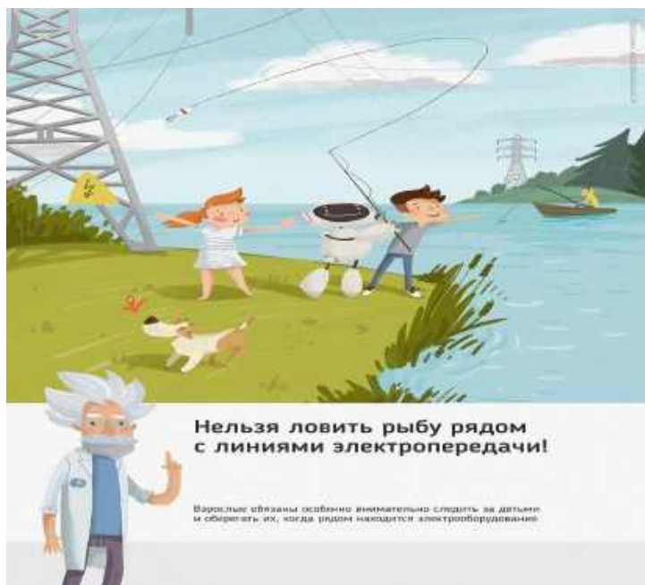
Рис. 4 Нельзя ловить рыбу рядом с линиями электропередачи

Об открытых подстанциях, оборванных проводах нужно сообщить в Кубанское ПМЭС по телефону 8-861-219-40-20 или позвонить на единый телефон всех экстренных служб 112.